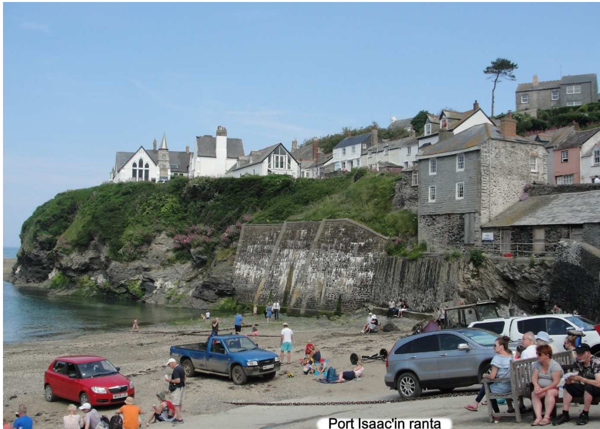
Port Isaac'in ranta

näytetään vain pihalta, kuten Docin taloakin. Sisäkuvaukset tehdään muualla. Myös rouva Tishellin emännöimä apteekki oli oikeasti pikkuputiikki nimeltä Buttermilk ja siellä myydään erilaisia käsintehtyjä toffeemakeisia. Huomasin, että turisteja käy kylässä paljon, niin monia putiikkeja siellä oli erilaisine meriaiheisine matkamuistoinen. Muuten ei kauppa niissä varmaan kannattaisi. Aikaa kylävierailullemme oli kaksi tuntia ja lounas piti syödä lennossa, että ehti katsoa tärkeimmät paikat ja ottaa kuvia. Ostimme siksi NickiB's Pasty Shopista mukaan paikalliset pasteijat, ”cornishpastyt” jossa voitaikinan sisällä on erilaisia täytteitä. Etsiessäni ko. paikkaa netistä, huomasin myös prinssi Charlesin vierailleen paikassa v. 2016, ja hänestä on hauska kuva, kun hän on juuri saamassa käteensä kyseisen ruokalajin. Se on jonkinlaisen sekoitus meille tutuista pasteijoista ja lihapiirakasta. Hyvin täyttävä, mutta mauton minun mielestäni.