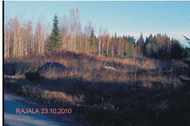
Rajalan torpan paikka 23.10.2010