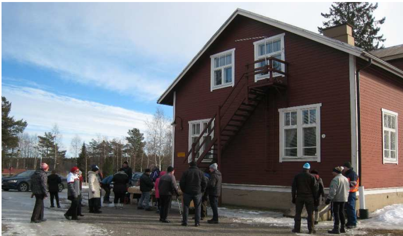
Kuvassa ”kevätk aikauksen” osallistujia

Vaikka laskiaissunnuntaihin 3.3. tullessa lumet olivat huvenneet lähes olemattomiin isommilta aukeilta, koulun pihalla ”kevätk aikausta” maukkaan tarjoilun ja mukavan jutustelun merkeissä viettäessämme melkoiset aurauspenkat vielä kertoivat lumitalvesta.