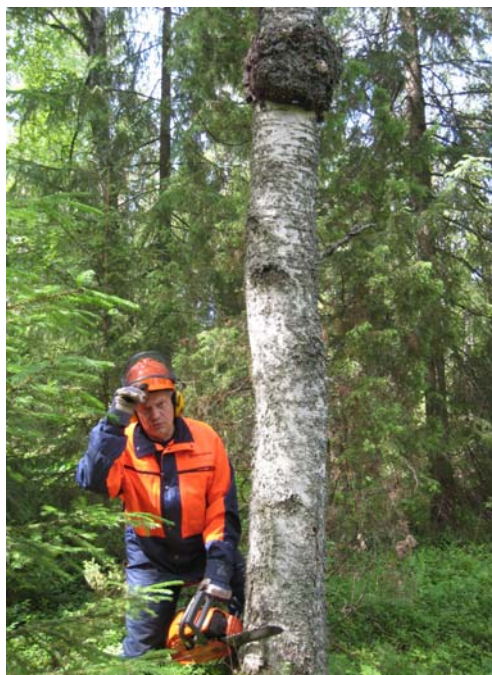
Tässä kirjoittaja on pakuriteetä hankkimassa.