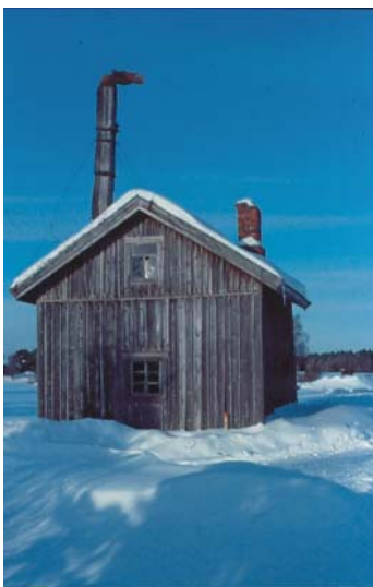
Hulolan vanha kuivuri