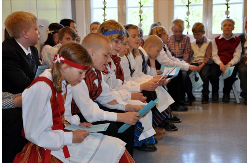
Koulun oppilaat seuraamassa juhlaa.